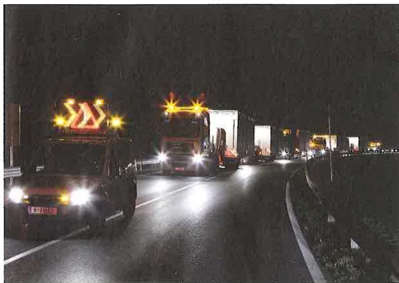
Fertigungsstraße in Reutte, 200 Kilometer auf Tiefladern – Sichtbohle zum Hotelzimmer.